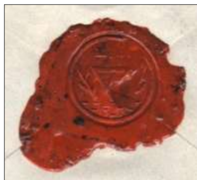
Ill.2 Privat lakksegl

Portoen er korrekt, 40 øre for brev mellom 20 og 125 gram til Norden pluss 20 øre for registreringen. Stempelet er datert 21-6-1939, senere enn registrert i Vestfoldkatalogen.