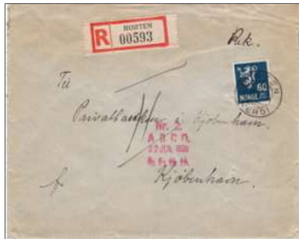
Ill.1. 60 øre rekommandert forsendelse til Danmark

I sin interessante artikkel om moderne poststempler i september 2009 nummeret av Budstikka skrev Bjørn Marstrøm at SA- stempelet HORTEN VERDI, nummer 13 i Vestfoldkatalogen, var bare registrert på noen klipp og frimerker, ikke på brev. Jeg kan nå rapportere at det fines på brev. I min samling har jeg en registrert konvolutt med dette stempelet. Som illustrasjonen (Ill.1) viser er brevet frankert med et 60 øres løvemerke, NK 211, har rek-lapp Horten 00593 og er adressert til Privatbanken i Kjøbenhavn.