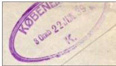
Ill.4 Ankomststempel Kjøbenhavn

Brevet tok bare en dag på veien til Kjøbenhavn, det ovale mottakerstempelet Kjøbenhavn K på baksiden er markert 3 Omb 22 JUN 39 (Ill.4).