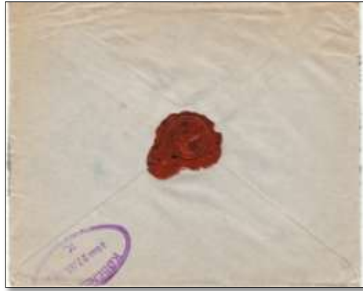
Ill.3 Brevets bakside med lakksegl og ankomststempel.

Brevet tok bare en dag på veien til Kjøbenhavn, det ovale mottakerstempelet Kjøbenhavn K på baksiden er markert 3 Omb 22 JUN 39 (Ill.4).